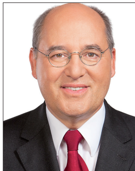
Dr. Gregor Gysi