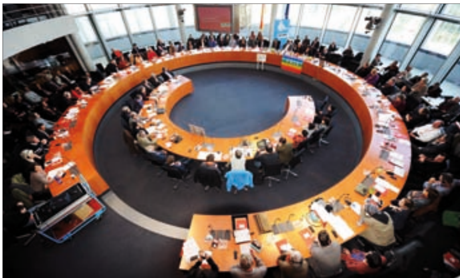
Zahlreiche Vertreterinnen und Vertreter der afghanischen Demokratiebewegung und der deutschen Friedensbewegung nahmen im Januar 2011 an der Konferenz „Das andere Afghanistan“ teil – auf Einladung der Fraktion DIE LINKE im Bundestag.