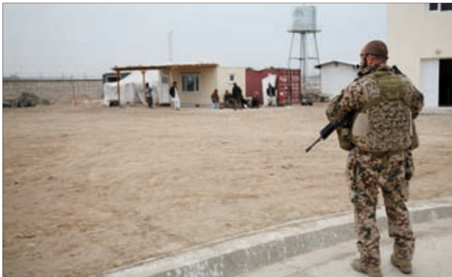
Ein Bundeswehrsoldat steht Wache in der Nähe des Bundeswehrlagers in Kundus.