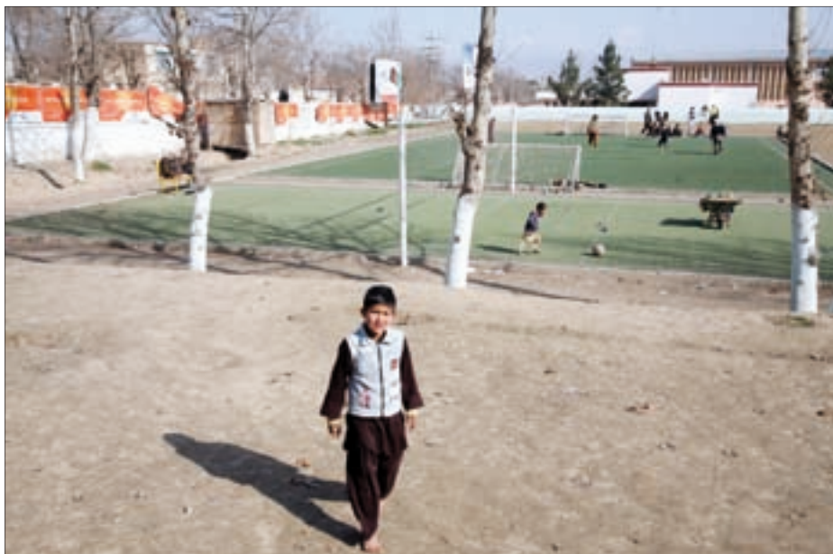
Auch das gehört zum Alltag: Kinder spielen Fußball in der Nähe des deutschen Bundeswehrlagers in Kundus.