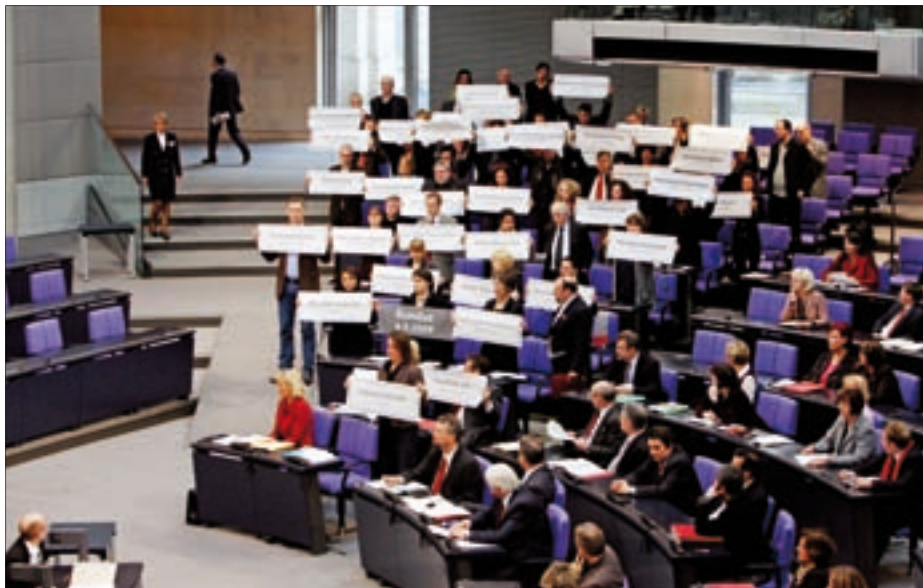
26. Februar 2010: Mitglieder der Fraktion DIE LINKE halten Schilder mit Namen der Opfer des Bombenangriffs der Nato am 4. September 2009 nahe Kundus hoch.