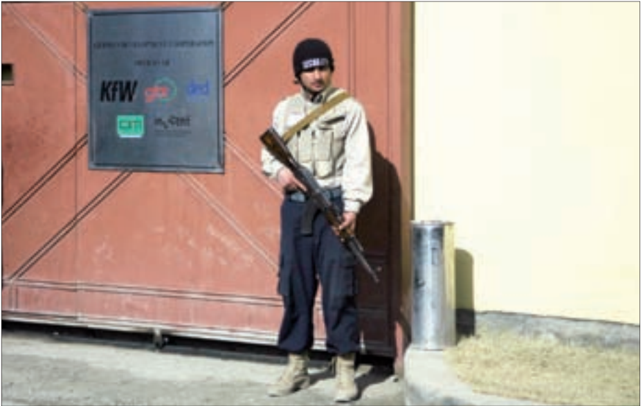
Ein afghanischer Wachmann bewacht einen Standort deutscher Entwicklungshilfeorganisationen.